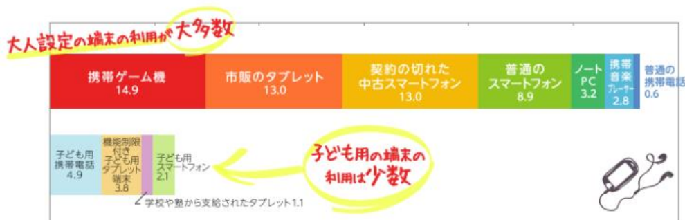
0～3歳児の専用端末の所有状況(2016年第9回未成年の携帯電話・スマートフォン利用実態調査より)

お子さまの専用端末として「携帯ゲーム機」、「市販のタブレット」、「契約の切れた中古のスマートフォン」を持たせている方が多くいらっしゃいました。子ども向けに設定された端末ではなく、大人が使用していたのと同じ設定のままお子さまに使用させているケースが多いようです。