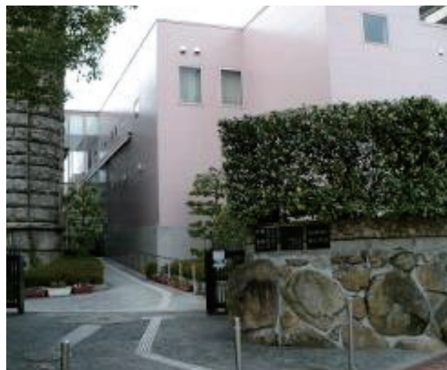
打出教育文化センター

こうしたオンライン学習環境整備には、校外から端末を用いて安心・安全にインターネット接続できるセキュリティ対策も同時に整備することが重要となります。Webセキュリティクラウドサービス「i-FILTER@Cloud」GIGAスクール版は、クラウド環境で迅速かつ容易に導入が可能で、学習に関係の無い有害情報の閲覧を制限するフィルタリングに加え、情報資産を狙う外部攻撃の脅威も防ぐ「ホワイト運用」を採用しております。柔軟なフィルタリングルールを管理者様が設定することで、通常は禁止されているインターネット上の動画閲覧を、文部科学省のYouTubeチャンネルや芦屋市が指定するデジタルコンテンツのみ許可するなど、特定の動画チャンネル・コンテンツを閲覧許可することが可能です。